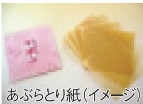
あぶらとり紙(イメージ)