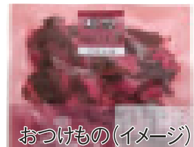
おつけもの(イメージ)