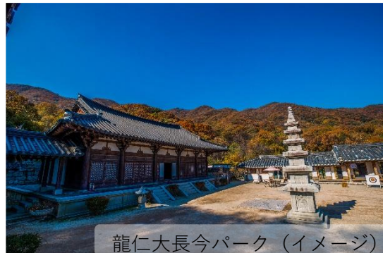
龍仁大長今パーク (イメージ)