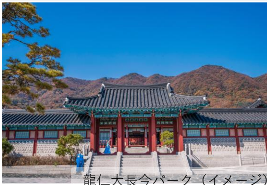
龍仁大長今パーク (イメージ)

三国時代以来の建築様式をそのまま再現した場所で、大長今パーク内でも最も美しい建築物のひとつに挙げられる。韓流ドラマのロケ地として有名。