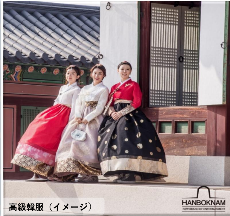
高級韓服 (イメージ)