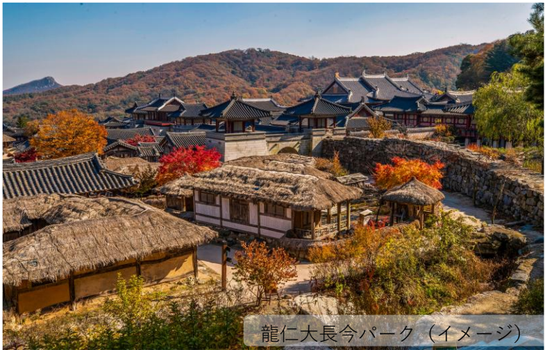
龍仁大長今パーク (イメージ)

2015年に一般公開が開始したMBCのドラマ撮影セット場。250万平方メートルもの広大な敷地に新羅時代から朝鮮時代までの建築物が立ち並び、当時の生活や風習を理解できるように街が整備され、食器や衣類など生活用品も展示されています。パーク内は、ドラマの名場面が蘇る記念撮影スポットの宝庫。