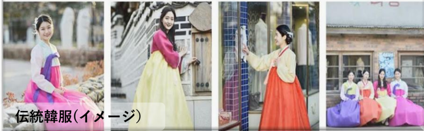
伝統韓服(イメージ)