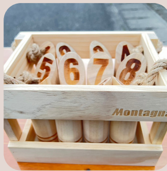
モルックチーム対抗戦！