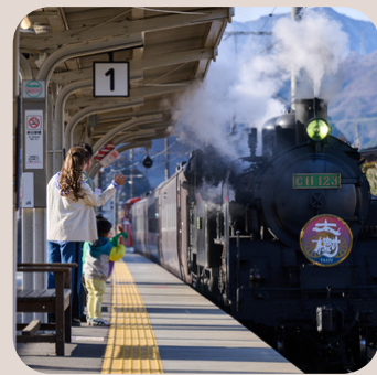
運が良ければ SLに会えるかも？