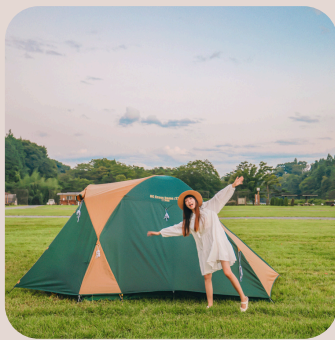
家族でテント設営♪

◎すぐ横には清流・鬼怒川 鬼怒川のせせらぎが心地よいBGMとなって、 ココロもカラダもリフレッシュ♪